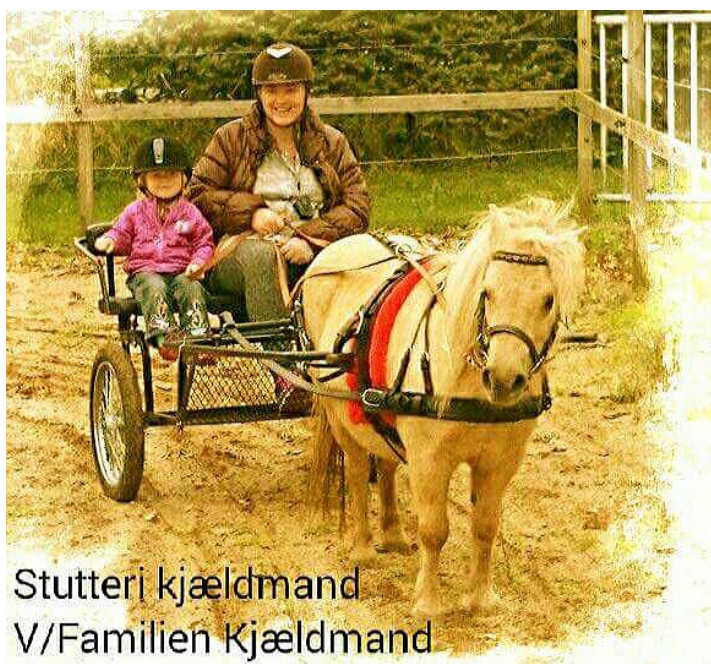
Stutteri Kjældmand V/Familien Kjældmand