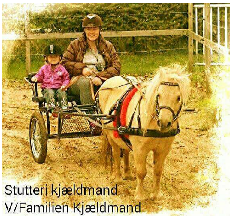
Stutteri kjældmand V/Familien Kjældmand