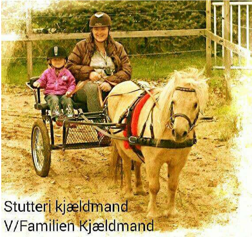
Stutteri Kjældmand V/Familien Kjældmand